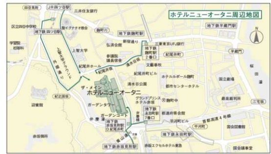
ホテルニューオータニ