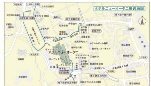
ホテルニューオータニ